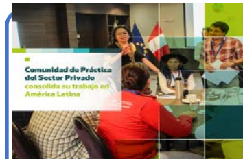
Intercambio entre iguales