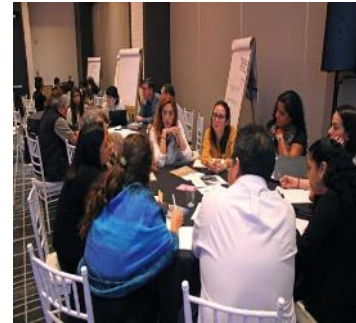
Intercambio de buenas / mejores prácticas