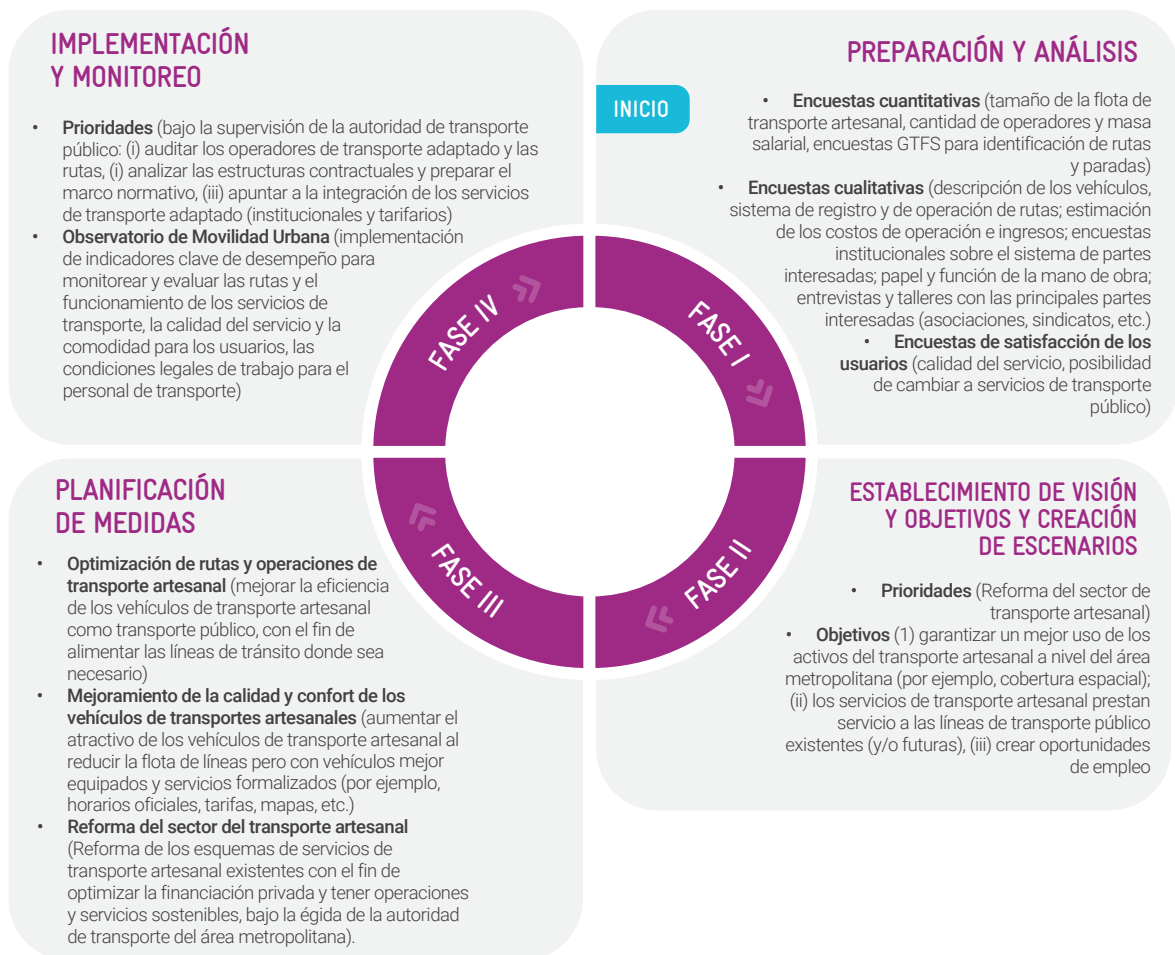
Figura 1. Integración del paratransito en el proceso del PMUS

Hay cuatro fases en el proceso del PMUS: preparación y análisis, desarrollo de estrategias, medidas de planeación e implementación y seguimiento. Gracias a este proceso, podemos prestar especial atención al paratransito en la preparación para la reforma del sector y la integración gradual de estos servicios en la esfera del transporte público convencional. Con Bajoe en el ejemplo del PMUS en Medan, Indonesia, el siguiente gráfico ofrece un ejemplo práctico de cómo se estudia e integra el paratransito en este enfoque de planeación de la movilidad.