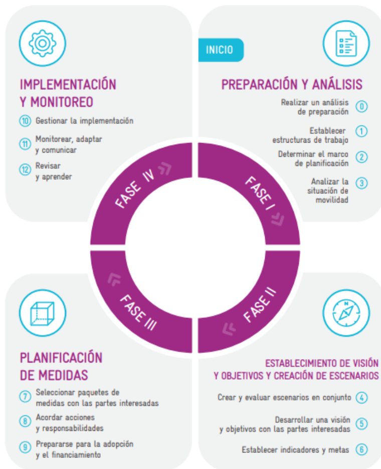
Figura 1. El Ciclo PMUS – 4 Fases y 13 Pasos. Fuente: elaboración propia a partir de Rupprecht Consult, Directrices para la Elaboración e Implementación de un Plan de Movilidad Urbana Sostenible.

La lista de verificación considera los elementos clave que son esenciales antes de comenzar la formulación del PMUS. Incluye soluciones viables para abordar las respuestas negativas de la lista de verificación y aconseja precaución contra la formulación del PMUS en ciertos casos. Esta lista de verificación se basa en las experiencias de MobiliseYourCity y sus socios implementadores en la formulación de PMUS. Además, se alinea con la propuesta metodológica articulada en el conjunto de herramientas de PMUS desarrollado por MobiliseYourCity, que incluye directrices , un modelo de TdR y una tabla de contenido anotada para los PMUS . Así como el Toolkit de gobernanza que se espera que se publique en 2024.