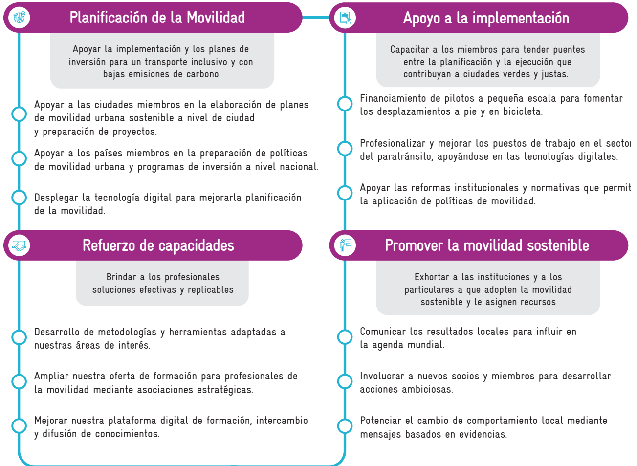
Gráfico 1. Las 4 áreas de servicio de MobiliseYourCity

La Alianza MobiliseYourCity apoya a las ciudades y países miembros a través de cuatro áreas de servicio principales. Ya se han recaudado 54,7 millones de euros para financiar proyectos en estas cuatro áreas de servicio.